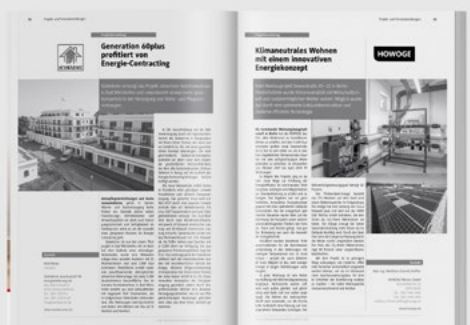
Abb: Seiten aus dem vedec-Jahrbuch 2021/20222